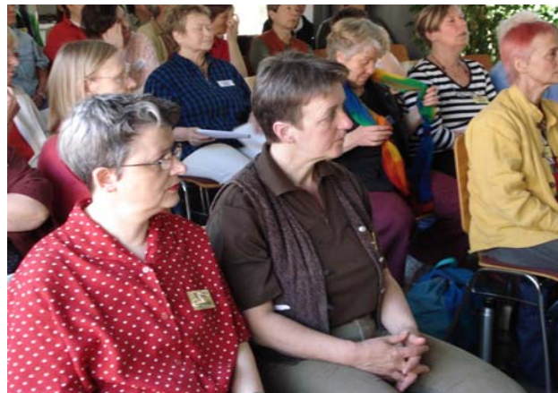
Tagung 2007 in Köln

Fraueninitiative 04 e.V. Münstereifeler Str. 9—13 53879 Euskirchen Tel. 02251-625 616 Fax 02251-625 629