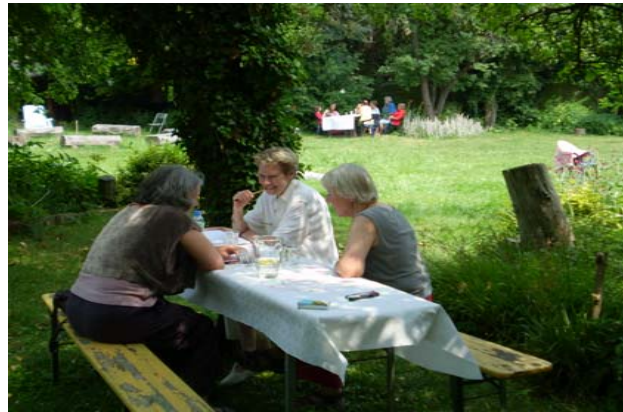
Tagung 2010 im Frauenbildungshaus-Zülpich

RAIBA-Rheinbach, Konto Nr. 230 2036 015, BLZ 370 696 27